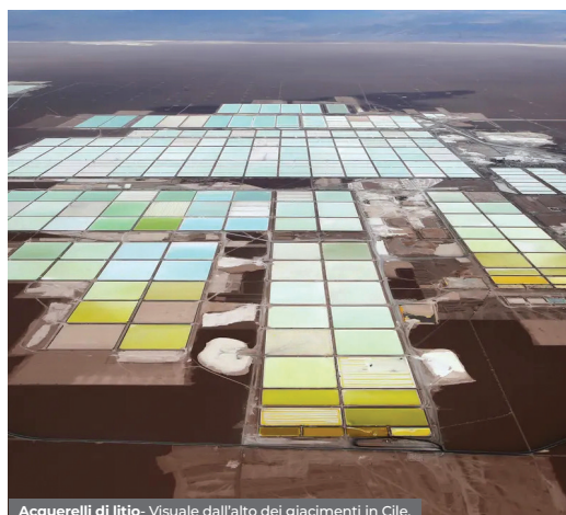
Acquerelli di litio. Visuale dall'alto dei giacimenti in Cile.

In Norvegia, sussidi e agevolazioni fiscali rendono il costo di un veicolo elettrico praticamente identico a quello di un'auto non elettrica. Il 74 per cento delle nuove auto vendute in Norvegia sono veicoli elettrici, mentre negli Stati Uniti è solo il 2 per cento.