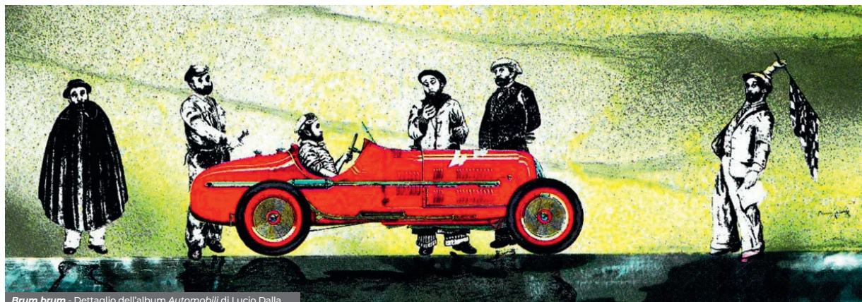
Brum brum - Dettaglio dell'album Automobili di Lucio Dalla.